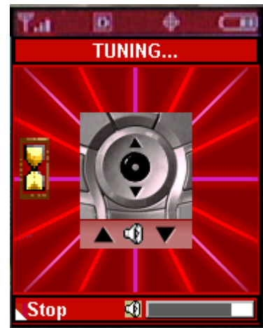
Figura 4 Sintonización de Radioemisora Predeterminada

Las teclas CLR y Stop (arriba-izquierda) pueden usarse para regresar al menú de aplicaciones y la tecla END lo enviará a la pantalla inactiva del teléfono.