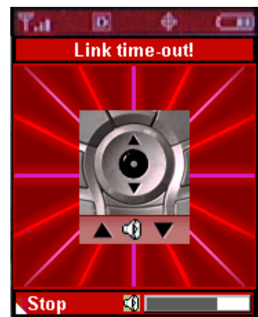
Figure 5 "LinkTime-out"